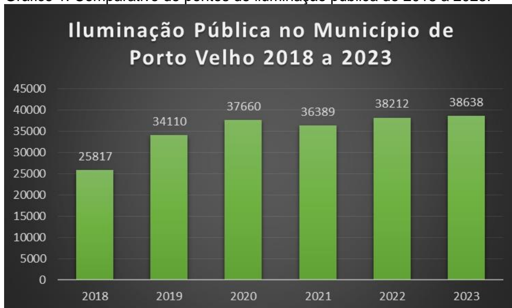
Gráfico 1: Comparativo de pontos de iluminação pública de 2018 a 2023.

Os dados apresentados representam os pontos de manutenção, implantação e revitalização por LED de iluminação pública e de espaços públicos no município de Porto Velho e seus distritos entre os anos de 2018 e 2023. Através do gráfico é possível observar a constância da prestação dos serviços fornecidos à população por meio desta Empresa Pública nos últimos seis anos, com a proporção de crescimento aproximada de 49,66% (tomando 2018 como referência) consequentemente formando novos parâmetros de atendimento a demanda pública.